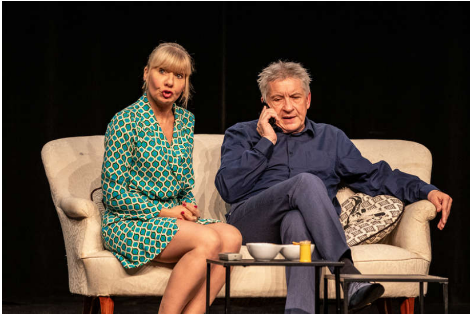
_original 3 :2