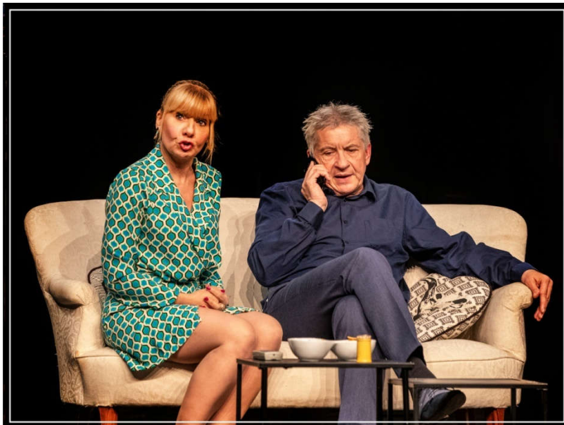
Bord perdu pour le passe partout 1/2 cm